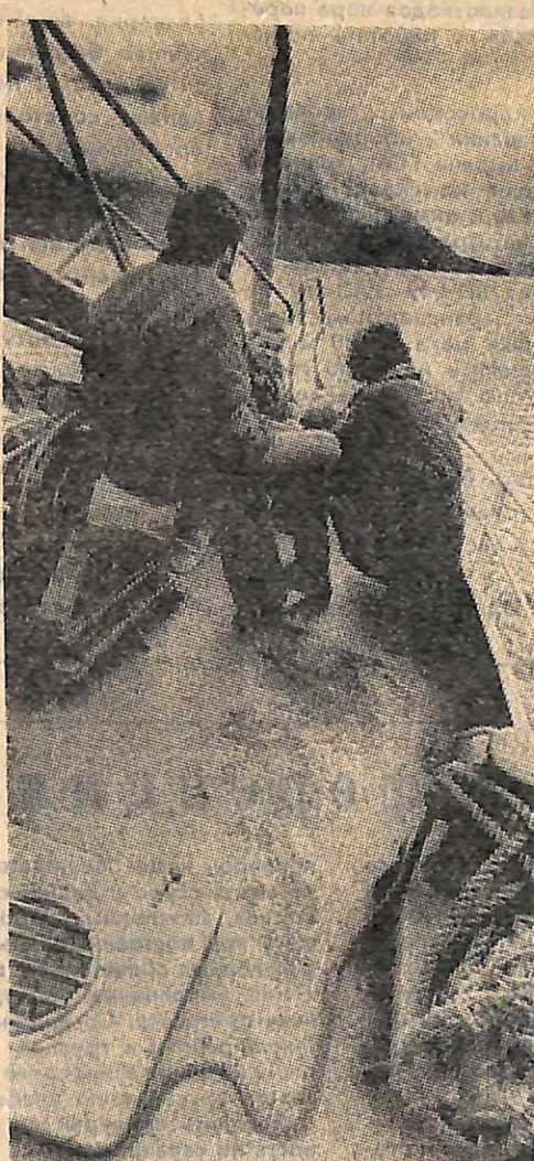
По родной стране. Г. Кудряшов, «Телецкое озеро».